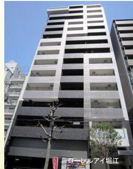
ローレルアイ堀江