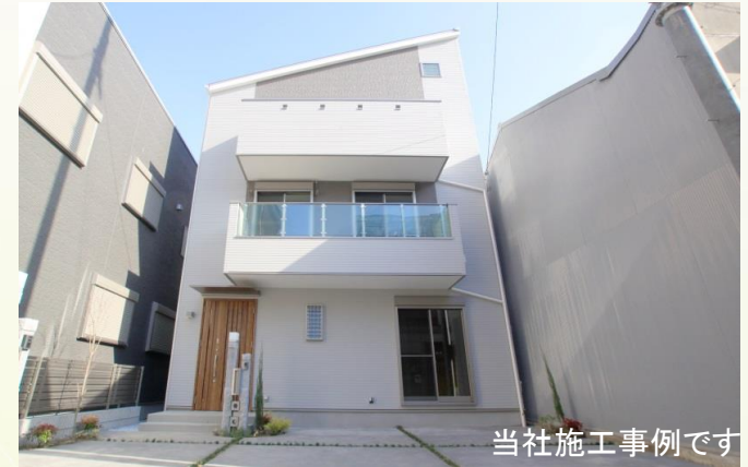
当社施工事例です

Ariettaとはイタリア語で『そよ風』を意味します。 さわやかな風が吹き抜ける～使い勝手の良い家をご提供致します。 夢創住宅がご提案するAriettaシリーズは間取りだけではなく、 周辺環境にもこだわりを持ってご提供しています。 充実の標準仕様設備にもきっとご満足いただけるはず... 夢創住宅のAriettaクオリティをご体感ください。