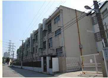
★伝法小学校 徒歩4分