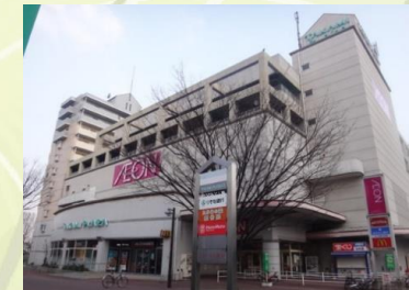
★イオン高見店 徒歩9分