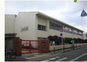
★伝法幼稚園 徒歩6分