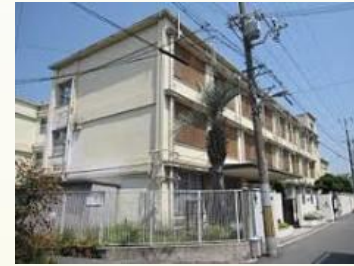
★此花中学校 徒歩2分