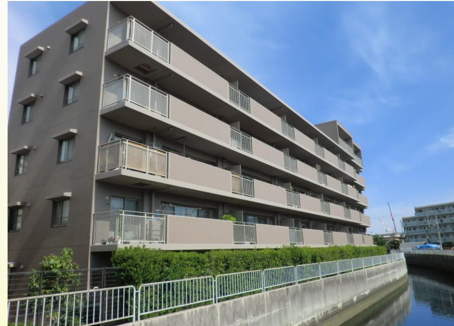
ロイヤルメドウ東心斎

名称 甲子園パーク・ホームズけやきみち 価格 3,380万円 管理費 11,400円／月 ガス漏れ警報器 250円／月 修繕積立金 8,230円／月 所在地 兵庫県西宮市甲子園浜田町15-30 交通 阪神電鉄本線「久寿川」駅 徒歩7分 阪神電鉄本線「甲子園」駅 徒歩8分 専有面積 63.29㎡ バルコニー面積 10.71㎡ 完成時期 平成12年4月 構造 RC造 地上6階建 2階部分 総戸数 31戸 取引形態 売主