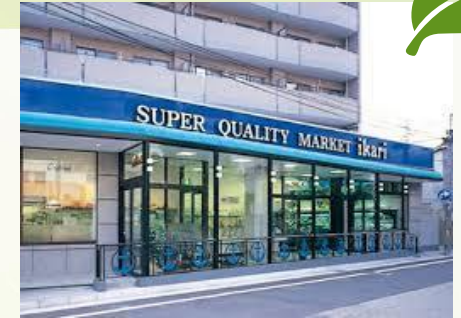
◆イカリスーパーマーケット