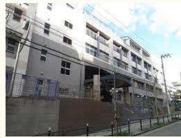
★天満中学校 徒歩18分