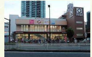
★イズミヤ天六樋之口店 徒歩2分