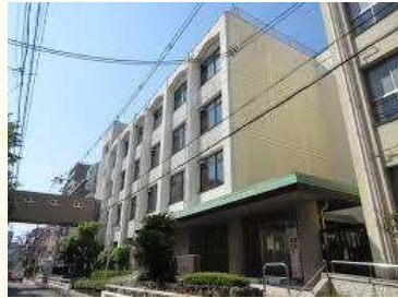
★菅北小学校 徒歩5分