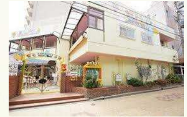
★鶴満寺保育園 徒歩6分