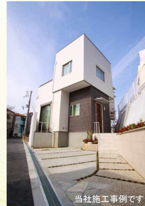
当社施工事例です