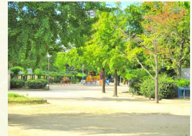
★下福島公園 徒歩8分