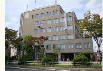
★福島区役所 徒歩9分