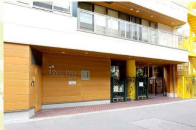
★新福島ちどり保育園 徒歩3分