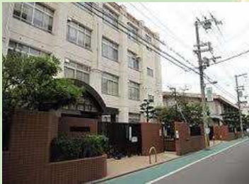
★吉野小学校 徒歩7分