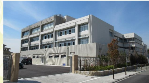
★香榎園小学校 徒歩7分