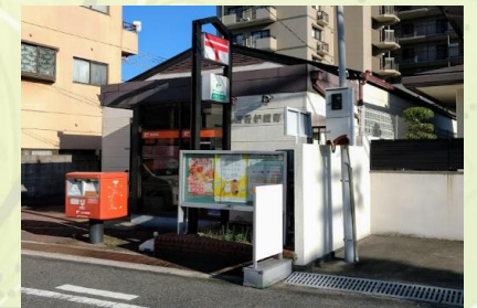
★香榎園郵便局 徒歩2分