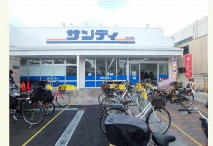
★サンディ香榎園店 徒歩2分